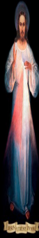
(RETIRO SIN COSTO) Información: (934) 878 0245